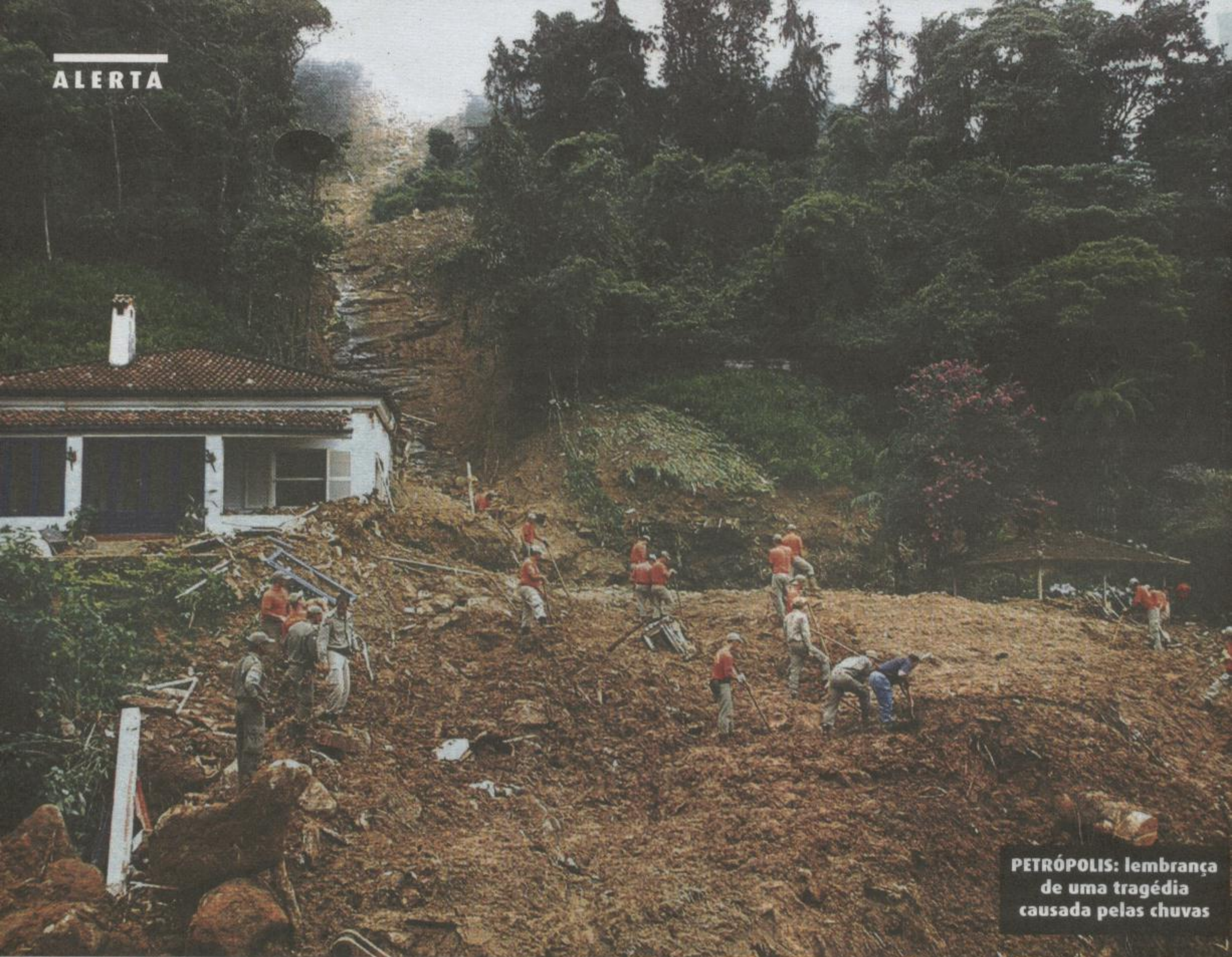
PETRÓPOLIS: lembrança de uma tragédia causada pelas chuvas

Ambientalistas e governo discutem o modelo ambiental